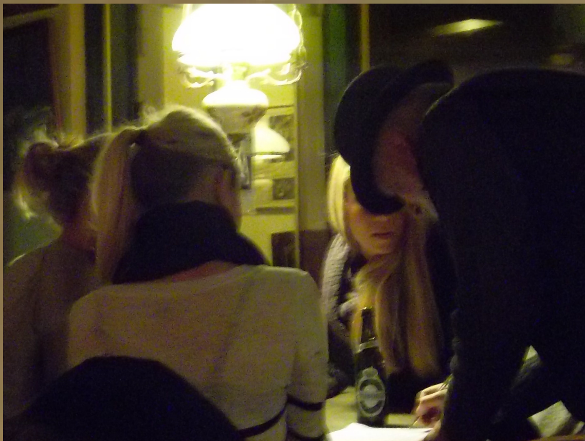
Censor retter på sine eksaminander og tegner for fortæller gerne, hvordan de forkerte svar skulle have lydt eller set ud. Den grønne dug er imidlertid byttet ud med et råt egetræsbord, og i stedet for vand er der serveret en Tuborg.

”Når alt andet svigter, så køb dig et værtshus,” slutter han og tager en slurk af sin fadøl. Næste quizoffer skal findes – både for hyggens og intellektets skyld.